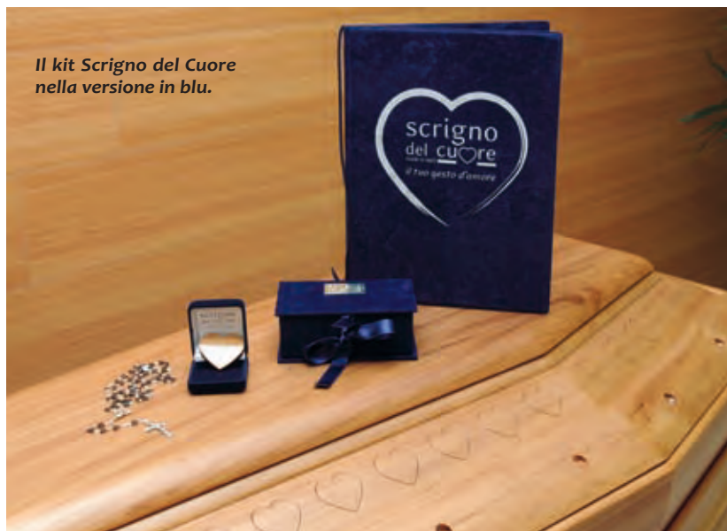
Il kit Scrigno del Cuore nella versione in blu.